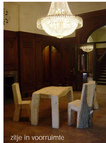
zitje in voorruimte

Raad voor de Rechtspraak Inrichting werkvertrekken, vergaderzalen, interieur voorzitterskamer, lunchruimte en bibliotheek. Gebouw: Frank van der Vecht en Marc van Roosmalen