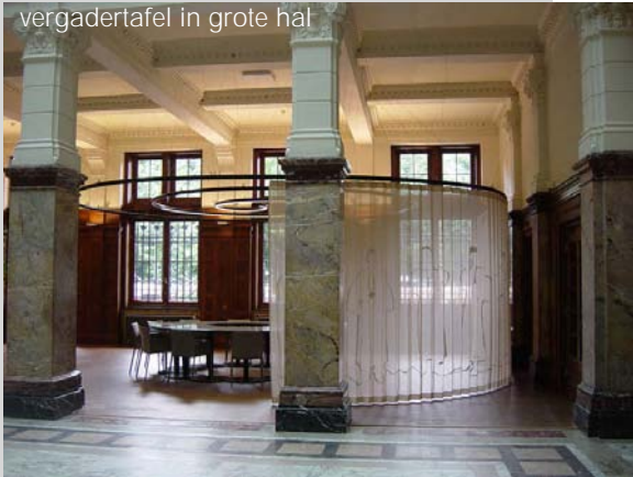
vergadertafel in grote hal