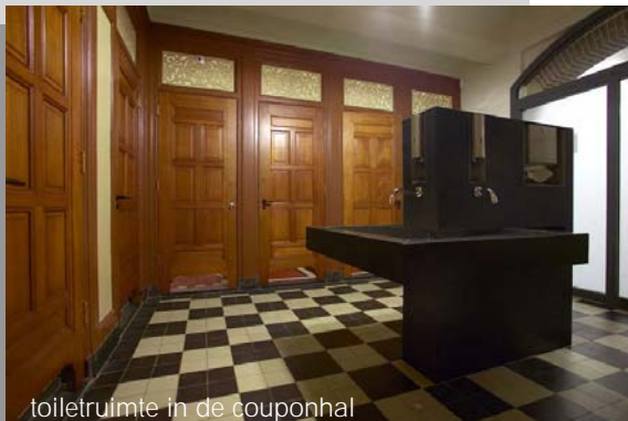
toiletruimte in de couponhal