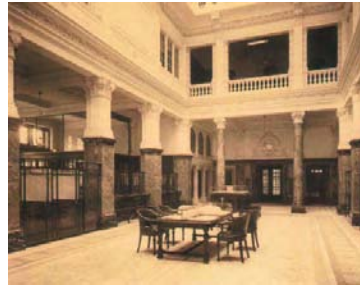
vergadertafel in grote hal