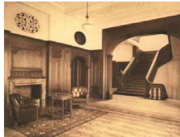
zitje in voorruimte